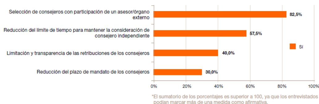
Medidas para fomentar un mayor grado de independencia en el Consejo de Administración

El informe recoge las principales tendencias en materia de gobierno de los Consejos de Administración. Sobre el debate entre separación o unificación de los cargos de consejero delegado y presidente del Consejo de Administración, el 80% de los consejeros entrevistados considera que en los próximos tres años se tenderá a la separación de ambas responsabilidades. Además, se les interrogó sobre el papel actual y futuro de los proxy advisors —entidades que prestan asesoramiento, principalmente, a inversores institucionales en relación con el ejercicio del derecho de voto—. Para los consejeros, este grupo de interés todavía no es prioritario